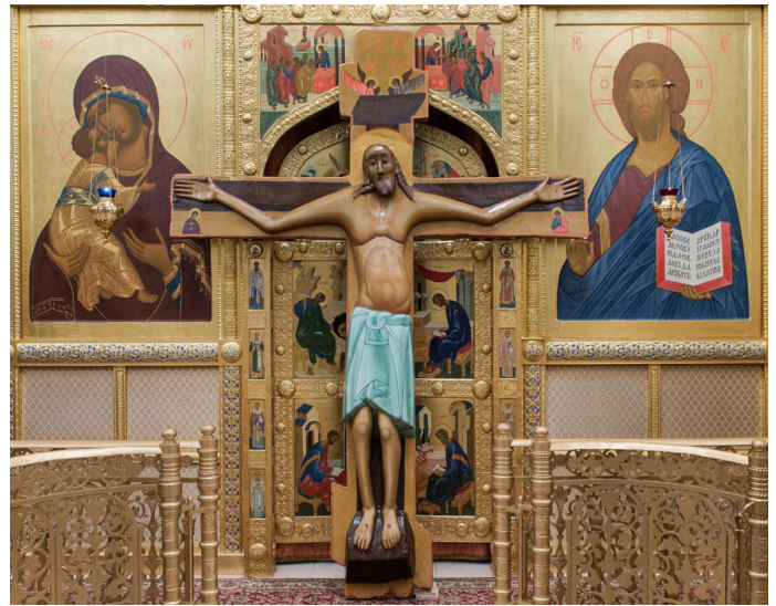
Копия Небоявленного Креста, установленная в Свято-Одигитриевском соборе г.Улан-Удэ 16 мая 2019 года, перед которой был отслужен молебен

в Севастополь, в разгар событий Киевского Майдана. Жители Крыма молились о том, чтобы у себя они могли жить мирно. Прошло совсем немного времени, и Крым вернулся под юрисдикцию России, причем бескровно.