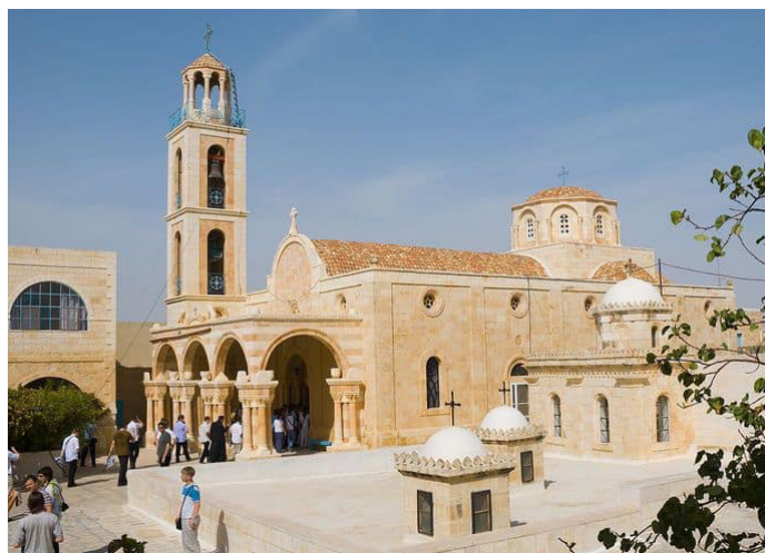
Лавра Феодосия Великого в Палестине

Но Феодосию трудно было ему подражать. Место, которое он выбрал для монастыря, резко отличалось от тех, в которых располагалось большинство лавр: вместо каменной пустыни — открытая горная возвышенность с плодородной почвой. И монахам он ставил сложнейшую