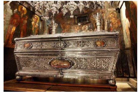
Мощи Спиридона Тримифунтского в храме на Корфу

Саркофаг дважды в день открывают для поклонения верующим, но иногда это не удается, крышка как бы сопротивляется. Верующие считают, что святой в этот момент в раке от-