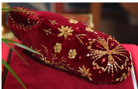
Башмачок Спиридона Тримифунтского

Самое массовое празднование проходит в Корфу 11 августа, когда вспоминают чудесное избавление жителей острова от Османского на-